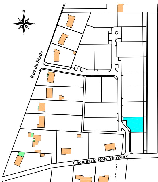
Plan de situation (sans échelle)

Lotissement autorisé le 7 septembre 2013 Arrêté N° PA 086.048.12.C.0001